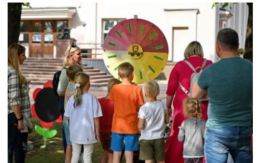
Pakruojo nestacionarių socialinių paslaugų centras „pastiprintas“ įvairiais lauko žaidimais – renginių metu norint išbandyti neretai net ir eilėje tenka luktelti ☺