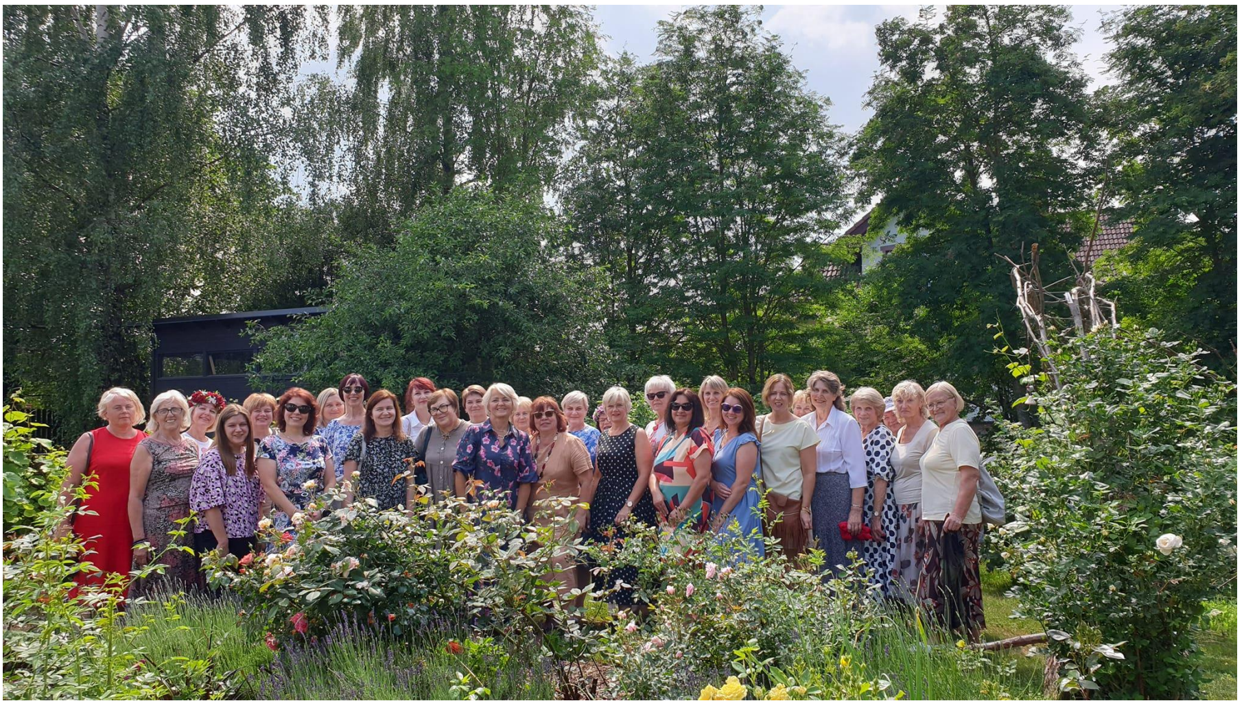
Po projekto baigiamosios konferencijos

Paskutinė akimirka dideliame būryje... Bet tik šiame projekte – paskutinė! Nes žinome, kad bendravimas ir bendradarbiavimas tęsis ir po projekto. Todėl nesakome „sudie“, o tik „iki greito!“