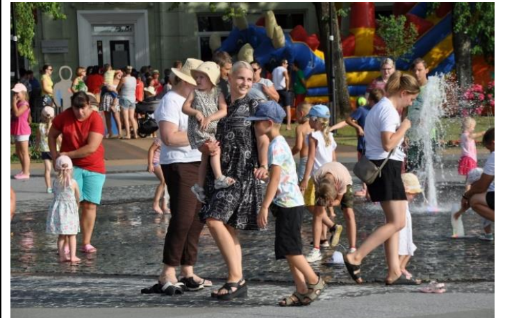
Šeimų šventė Pakruojuje

Rozalime vykusios piešimo pamokos, kurių metu dalyviai tapė paveikslus, dekoravo lininius maišelius ir netgi – skėčius, sulaukė tokio populiarumo ir sėkmės, kad net buvo surengta darbų paroda.