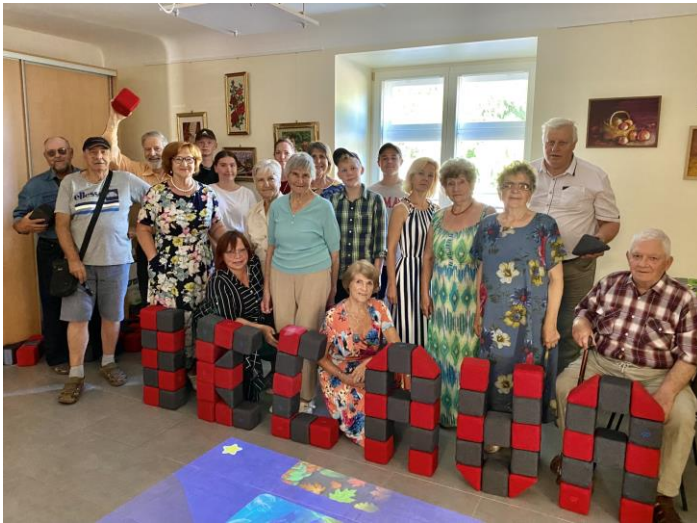
Proto lavinimo ir fizinio aktyvumo popietės „Jaunimas prieš išmintį“ Iecavoje

fizinio aktyvumo, proto lavinimo, emocinės ir psichinės sveikatos gerinimo užsiėmimus (Pakruojuje: šiaurietiškas ėjimas, treniruotės po atviru dangumi, stalo žaidimai lauke, šokių pamokos, piešimas; Iecavoje: proto lavinimo ir fizinio aktyvumo popietės „Jaunimas prieš išmintį“, naudojant įsigtus lauko žaidimus, interaktyvias grindis).