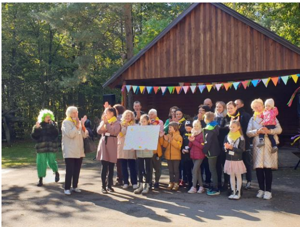
Senelių dienos šventėje Linksmučių pušynėlyje kartu su medžiais „ošė“ ir maži, ir dideli