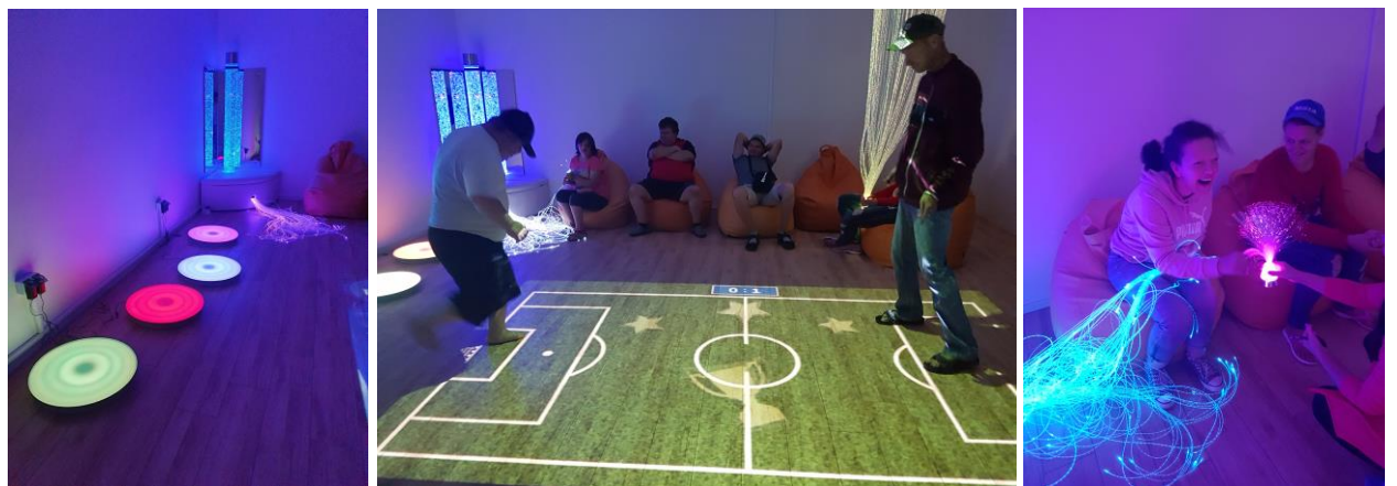
Klovainių sutrikusio intelekto jaunuolių centre įrengtas sensorinis kambarys - mėgiamiausia centro lankytojų vieta

„Klovainių sutrikusio intelekto jaunuolių centro jaunuoliai labai patenkinti projekto metu įrengtu sensoriniu kambariu. Tai tikrai pagerino teikiamų socialinių paslaugų kokybę. Sensorinis kambarys įveikintas kiekvieną dieną, parenkant užsiėmimus individualiai kiekvienam lankytojui ar jų grupėms – sensoriniu kambariu naudojasi 23 centro lankytojai, užimtumo veikloms organizuoti paskirtas darbuotojas-užimtumo specialistas.