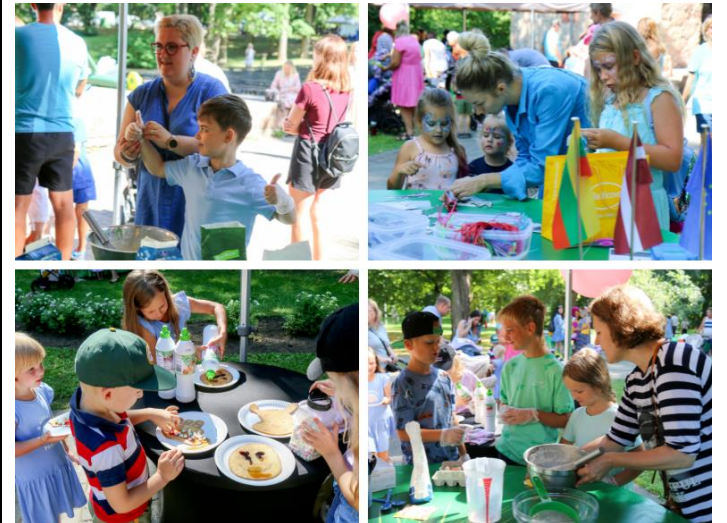
Šeimų šventė Iecavoje