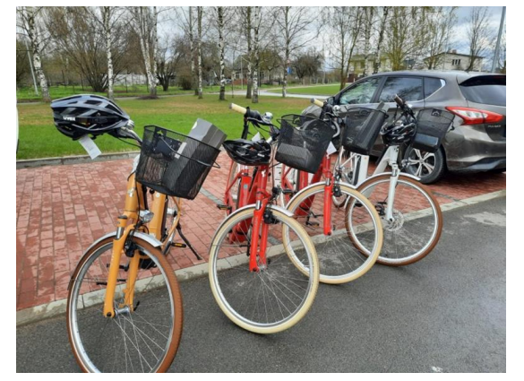
Nauju kompaktišku automobiliu ir keturiais elektriniais dviračiais džiaugiasi ir lecvos socialinės tarnybos darbuotojai – teikti lankomosios priežiūros paslaugas dabar gerokai lengviau ir patogiau