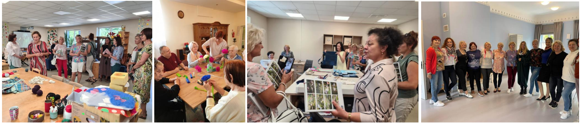
Mokymų ir pažintinių vizitų metu socialinėje srityje dirbantys specialistai kėlė kvalifikaciją ir stiprino draugystę

Akivaizdu, kad net ir turint būrį pagalbininkų savanorių, be tinkamos kvalifikacijos specialistų, dirbančių socialinėje srityje, tokių gerų rezultatų pasiekti nebūtų įmanoma, todėl gal net svarbiau nei investicijos į infrastruktūrą yra investicijos į žmogiškuosius išteklius – siekiant užtikrinti socialinių paslaugų efektyvumą, projekto partneriai suorganizavo 4 jungtinius seminarus, kuriuose socialinėje srityje dirbantys specialistai kėlė kvalifikaciją semdamiesi žinių, kaip įvertinti ir sukurti psichologinį saugumą, kaip į socialinį darbą pritraukti savanorius, kaip suvokti skirtumus tarp kartų ir kaip išvengti užprogramuotų konfliktų, kaip užtikrinti pozityvų bendravimą tiek su klientu, tiek su kolegomis. Mokymuose iš viso dalyvavo 26 specialistai, iš kurių 14 dalyvavo ir mokomajame pažintiniame vizite Lenkijoje – lankėsi socialinėse įstaigose, bendruomenėse, nevyriausybinesse organizacijose, kur susipažino su geraisiais šios šalies pavyzdžiais socialinėje srityje.