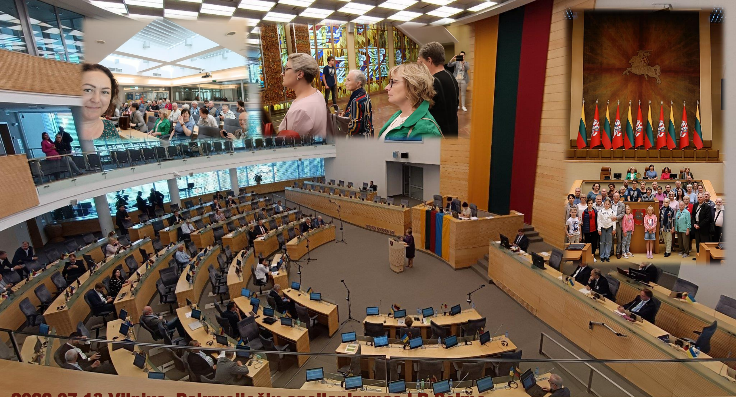
2022-07-13 Vilnius. Pakruojiečių apsilankymas LR Seime