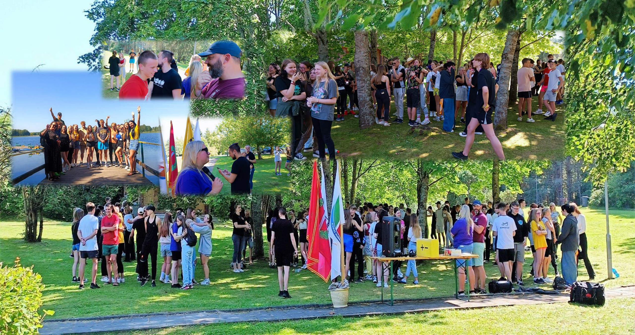
2022-08-12 Tytuvėnai. Vasaros stovykla „Judinam vasara 4“ finišas