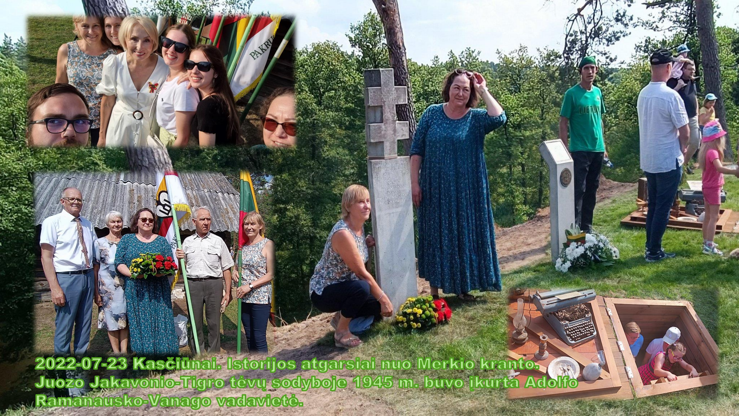
2022-07-23 Kasčiūnai. Istorijos atgarsiai nuo Merkio kranto. Juozo Jakavonio-Tigro tėvų sodyboje 1945 m. buvo įkurta Adolfo Ramanausko-Vanago vadavietė.