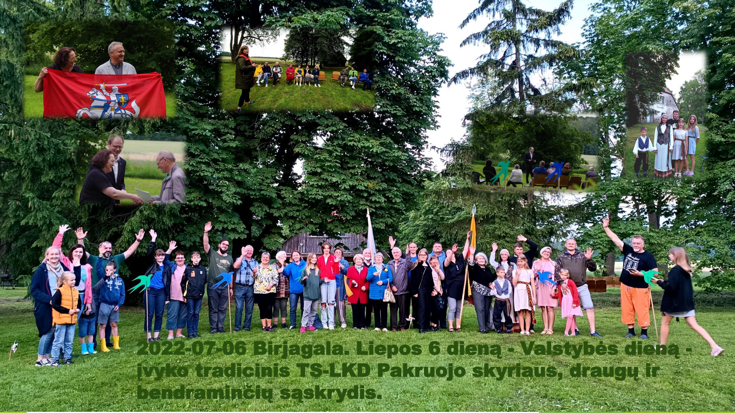
2022-07-06 Birjagala. Liepos 6 diena - Valstybės diena - įvyko tradicinis TS-LKD Pakruojo skyriaus, draugų ir bendraminčių sąskrydis.