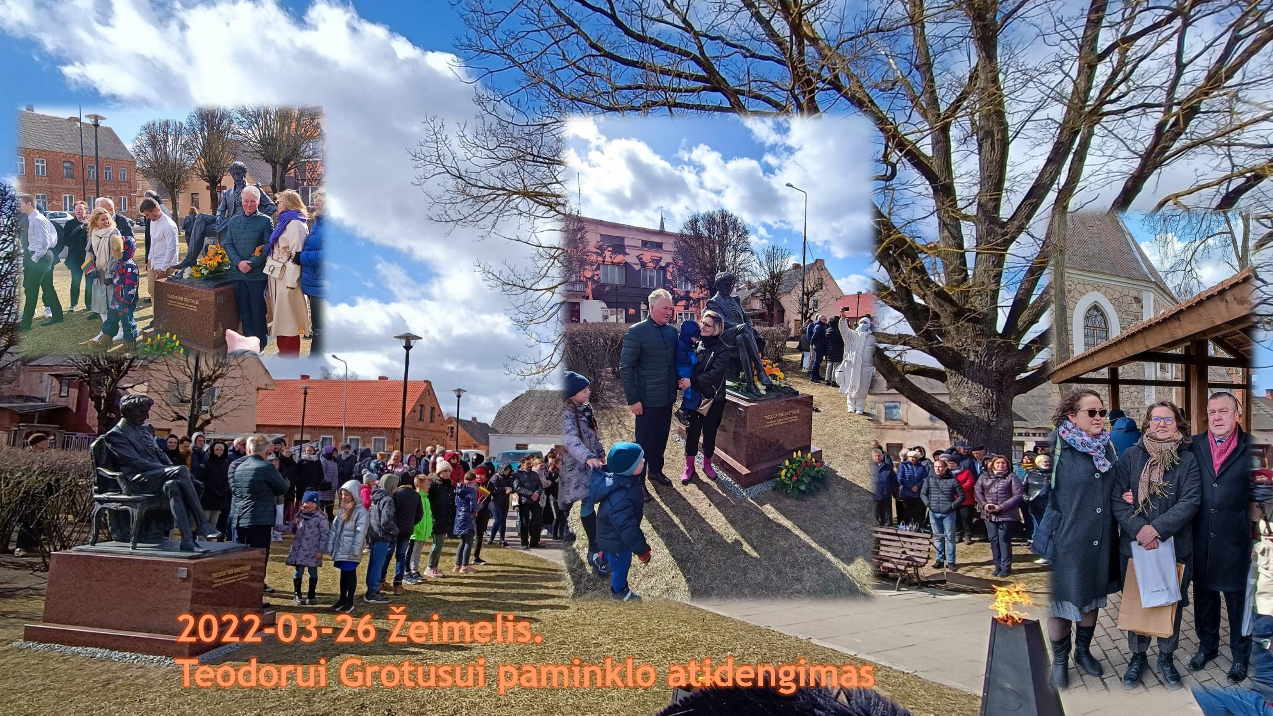
2022-03-26 Žeimelis. Teodorui Grotušui paminklo atidengimas