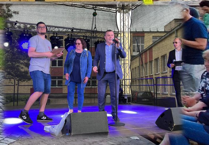
2022-06-18 Rozalimo miestelio 255 metų jubiliejiniai renginiai - jaunimo festivalio "Ošlam"