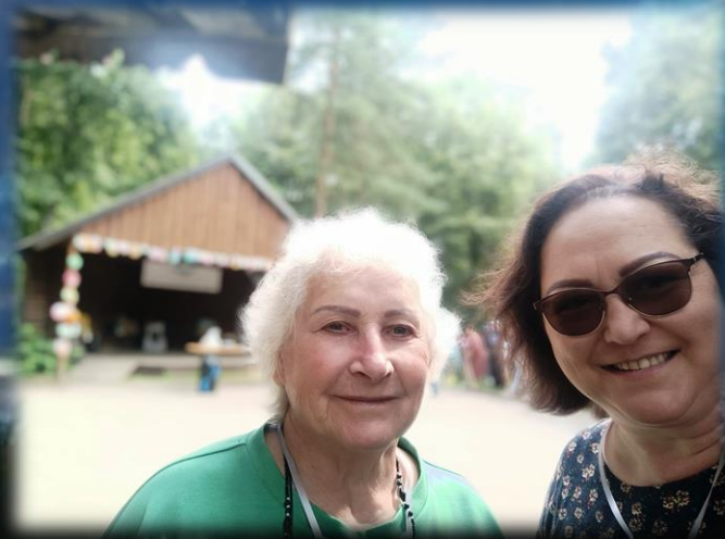
2022-07-15 Linksmučiai. Pakruojo neįgaliųjų draugijos Spartakiada