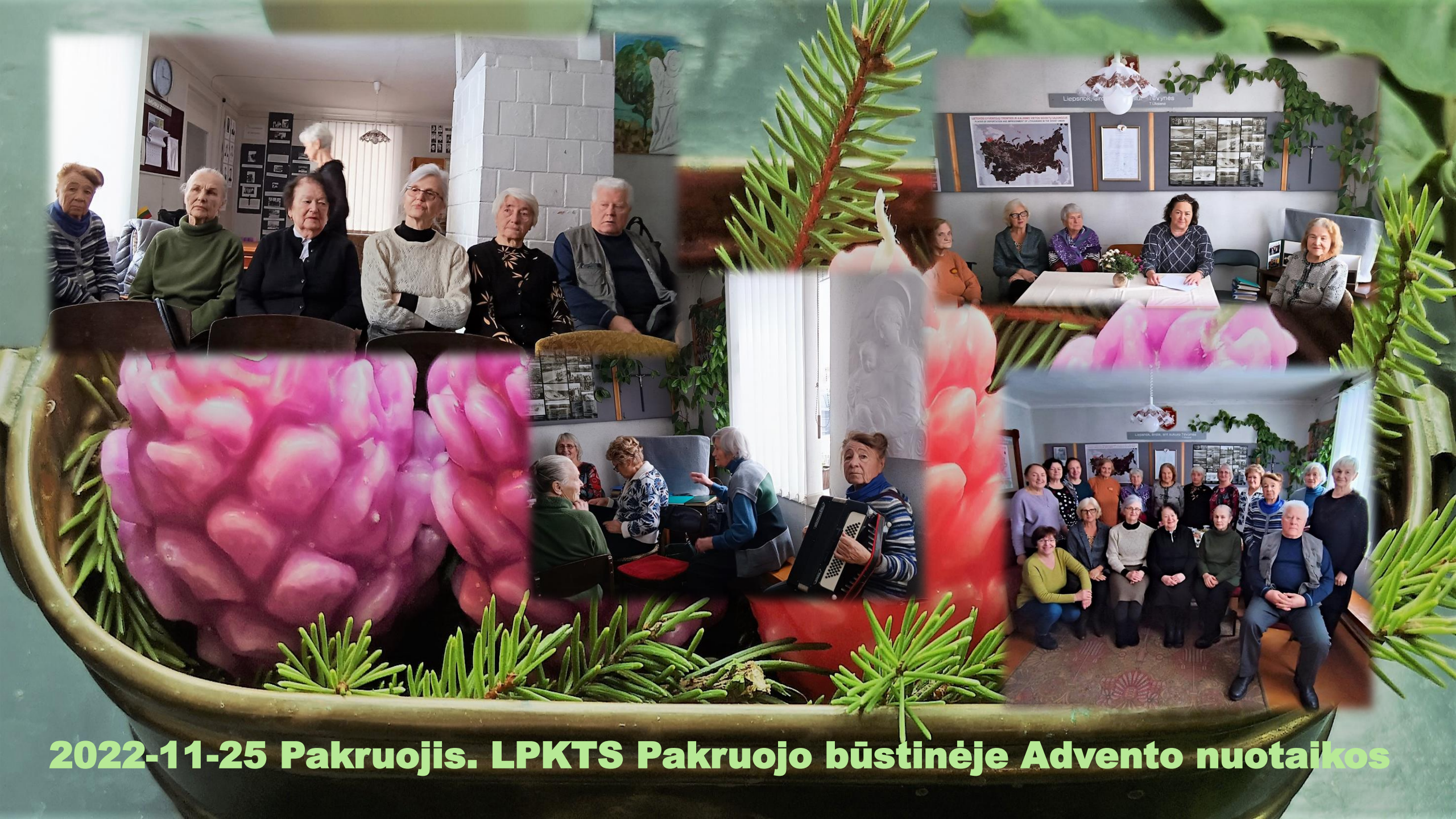
2022-11-25 Pakruojis. LPKTS Pakruojo būstinēje Advento nuotaikos