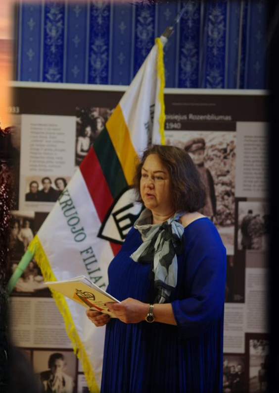
2022-09-10 Pakruojis. LPKTS Pakruojo filialo Atstovų konferencija