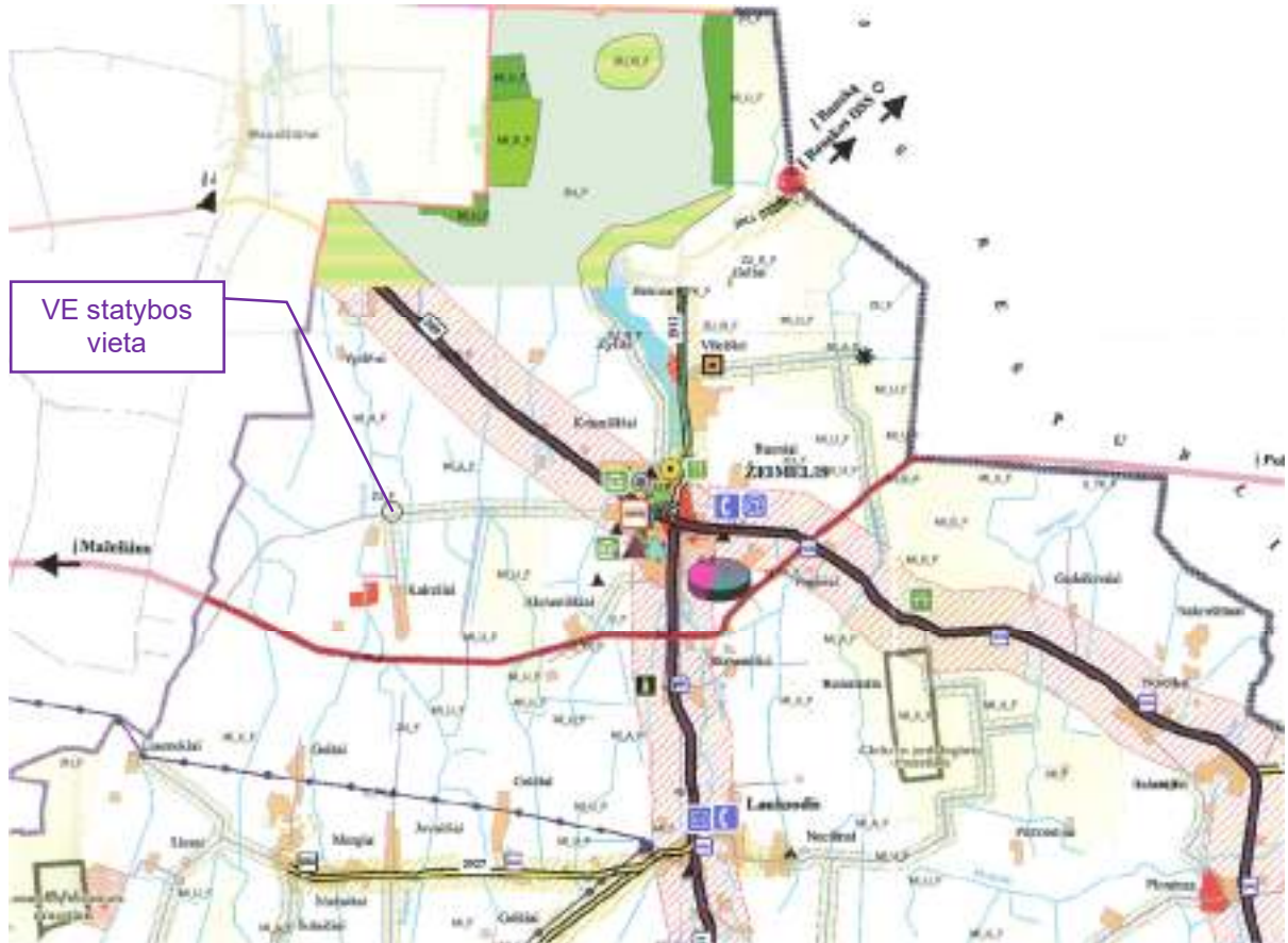
6 pav. Planuojamų statyti statinių schema inžinerinės infrastruktūros ir susisiekimo brėžinio kontekste

Inžinerinės infrastruktūros ir susisiekimo brėžinio sutartiniai žymėjimai: