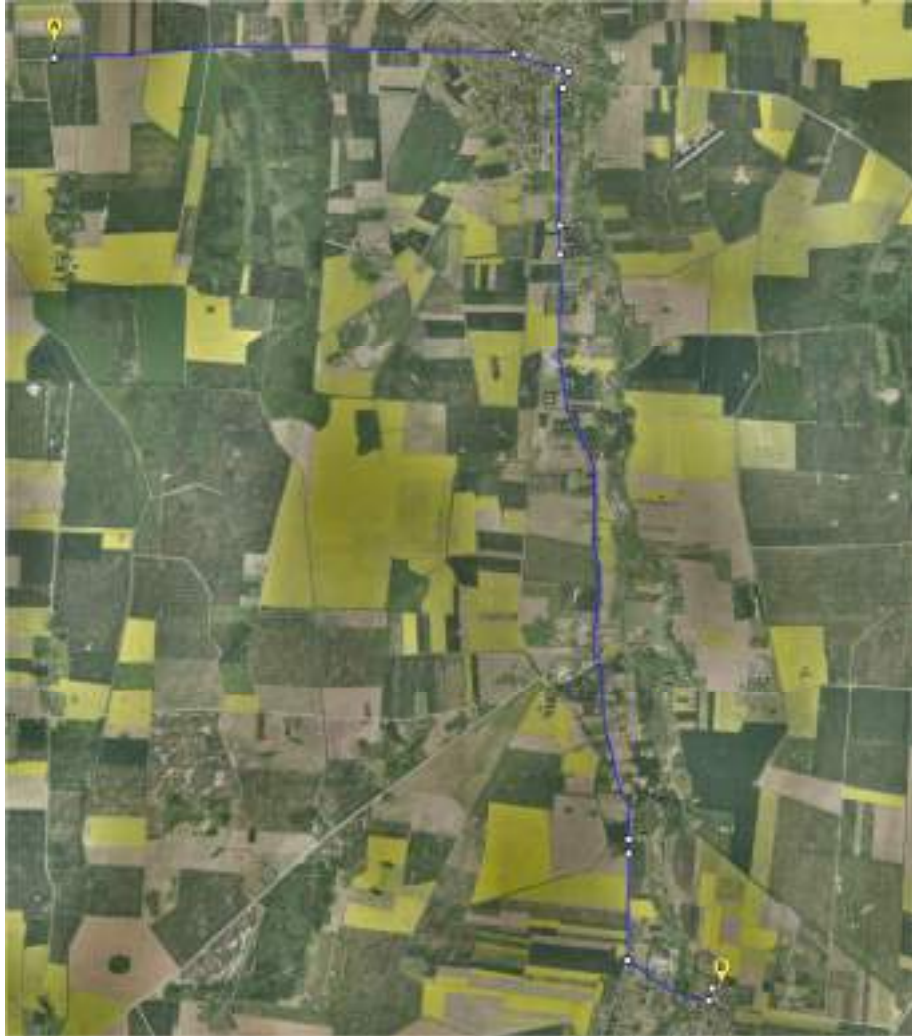
3 pav. PGT komandos maršrutas

Atstumas iki Žeimelio priešgaisrinės gelbėjimo tarnybos, esančios adresu Mokyklos g. 1, Bardiškių k., 83362 Pakruojis r., yra apie 10,50 km. Kelionės trukmė – apie 24 min.