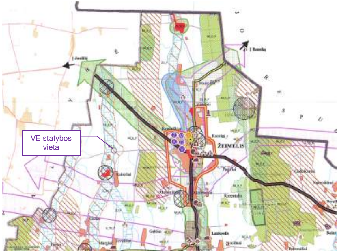
4 pav. Planuojamų statyti statinių schema žemės naudojimo ir apsaugos reglamentų brėžinio kontekste Žemės naudojimo ir apsaugos reglamentų brėžinio sutartiniai žymėjimai