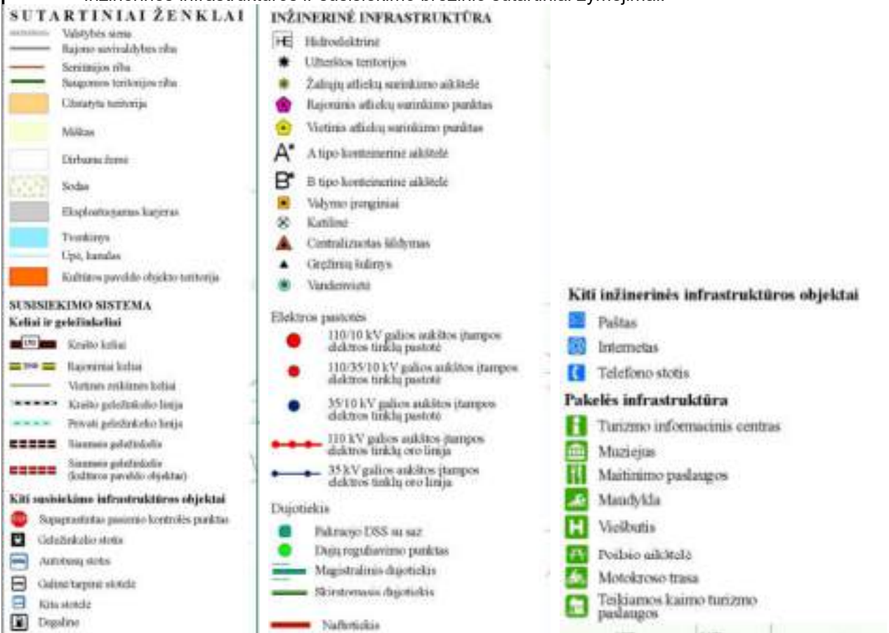
7 pav. inžinerinės infrastruktūros ir susisiekimo brėžinio sutartiniai žymėjimai

Inžinerinės infrastruktūros ir susisiekimo brėžinio sutartiniai žymėjimai: