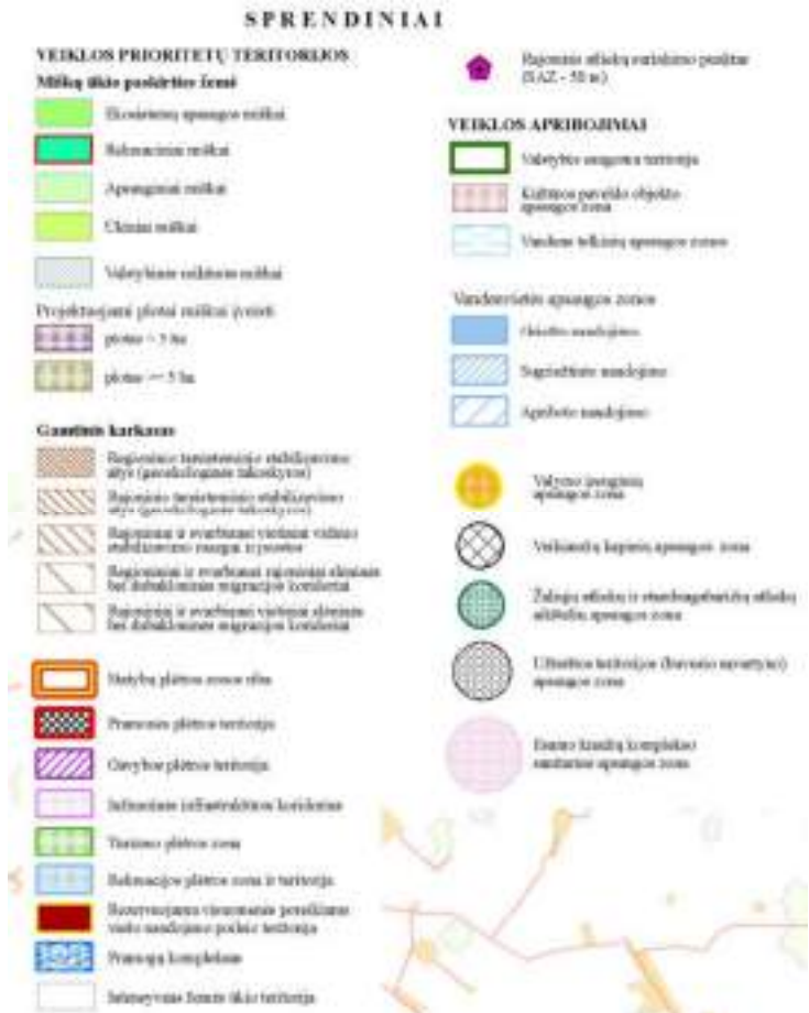
5 pav. Žemės naudojimo ir apsaugos reglamentų brėžinio sutartiniai žymėjimai