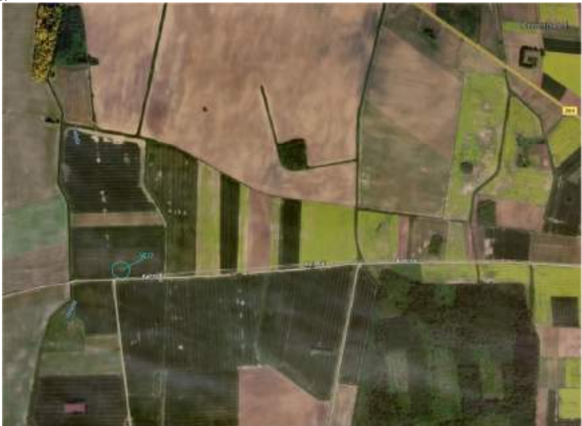
1 pav. Situacijos schema

Šiame projekte numatytą VE17 (pagal PAV atranką VE20-1) vėjo elektrinę planuojama statyti Statytojo nuomos teise valdomoje sklypo dalyje, adresu Pakruojo r. sav., Žeimelio sen., Kairelių k. Planuojamos vėjo elektrinės situacijos schema pavaizduota 1 pav. Pažintiniai duomenys apie sklypą pateikiami toliau esančioje 2 lentelėje.