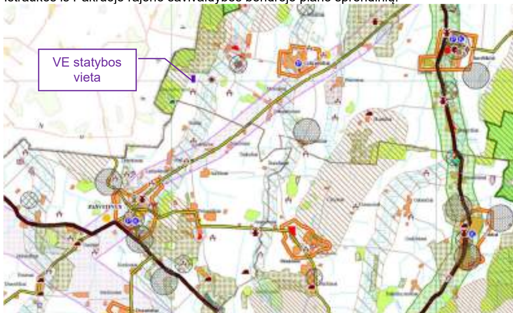
4 pav. Planuojamų statyti statinių schema žemės naudojimo ir apsaugos reglamentų brėžinio kontekste

Ištraukos iš Pakruojo rajono savivaldybės bendrojo plano sprendinių: