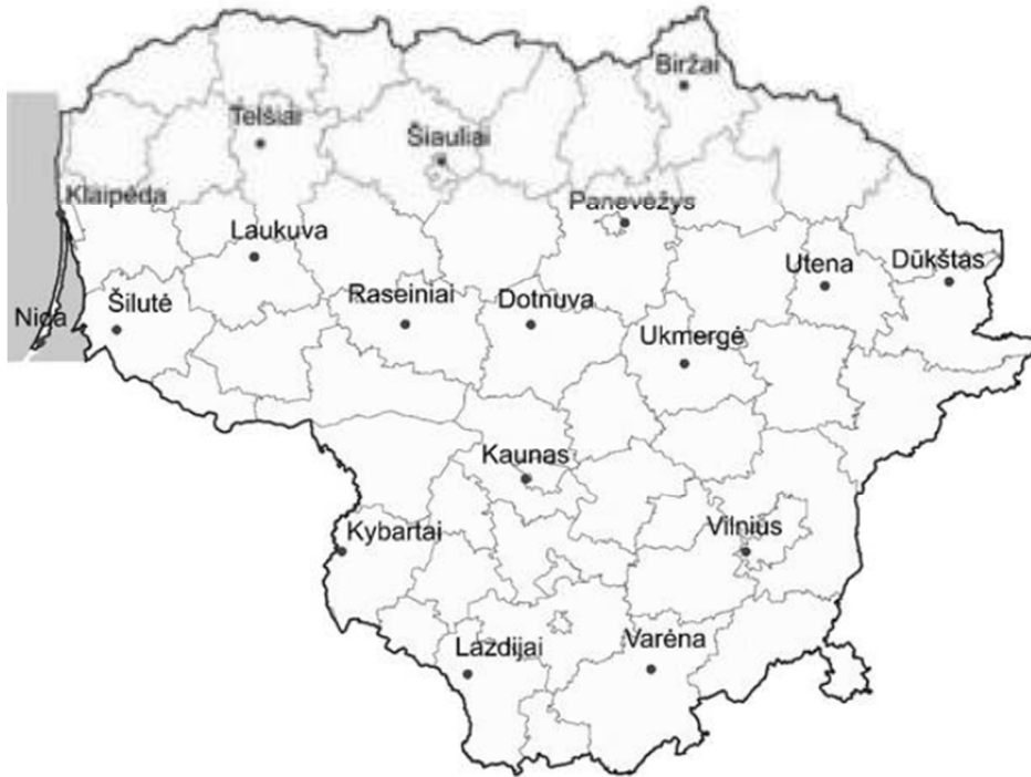
2 pav. Meteorologijos stočių žemėlapis