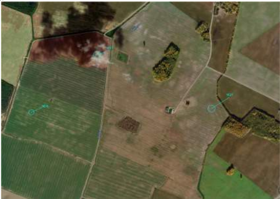
1 pav. Situacijos schema

Šiame projekte numatytą VE27 (pagal PAV atranką VE3-5) vėjo elektrinę planuojama statyti Statytojo nuomos teise valdomoje sklypo dalyje, adresu Pakruojo r. sav., Žeimelio sen., Aukštadvario k. Planuojamos vėjo elektrinės situacijos schema pavaizduota 1 pav. Pažintiniai duomenys apie sklypą pateikiami toliau esančioje 2 lentelėje.